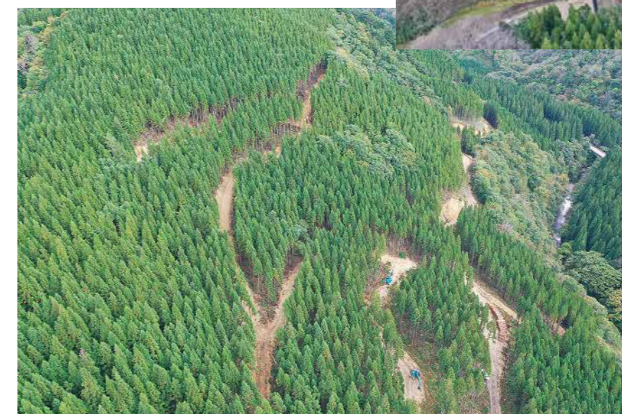
←中継地内間伐作業現場