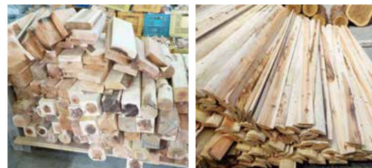
↑ ■在庫一掃 セールで販売した端材(写真左)と側板(写真右)

今後も、主幹事業である土木資材の量産販売と共に、地域に根差した製品開発やサービスを展開できるよう努力して参ります。