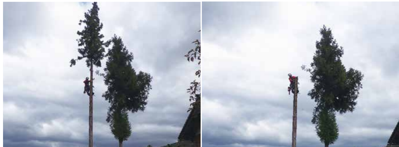
敷地内の杉伐採作業 隣接する建物があり、安全に根元から伐採することができない状況で、クライミングロープで登り、樹幹をトップカットして伐採した事例

森林整備課では人と樹木、街と森をつなげ、緑豊かな環境を築くとともに、樹木の利用や森林の利活用を広く提案し、人と樹木の新たな関係を構築します。